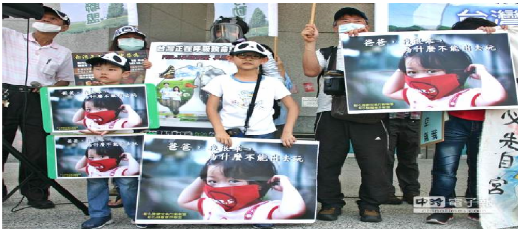
▲埔里鎮民為反空污集體走上街頭，小朋友手持「爸爸，我很乖，為什麼不能出去玩」